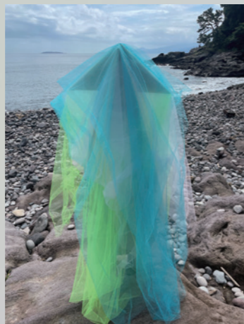
As you say, (work in progress) 2021