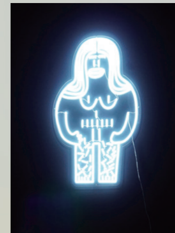
Altar to My First Home (extract), 2021